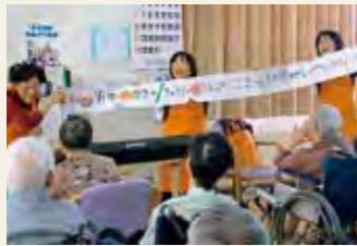
レクリエーション各種

毎回工夫を凝らした企画や朗読、歌、ゲームなど、多くのボランティアさんに支えられています。