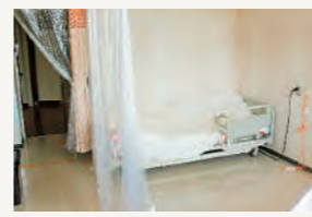
▲万が一の発生に備え、隔離部屋を準備

愛保育園では、登園時と午睡後の検温、食事の前やおもちゃの片づけ時の消毒をしています。子どもたちも「消毒お願いします」などと言ってお手伝いをしてくれ、協力体制が定着