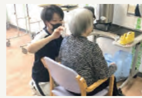
▲職員による髪のカット

静苑ホームではポスターなどで職員の意識向上を図るチーム、面会の制限や新しい方法を模索・実施する家族面会チーム、消毒設備を整備する環境対策チーム、クラスターが起きた場合の対応を決めるクラスター対策班などを設置しています。